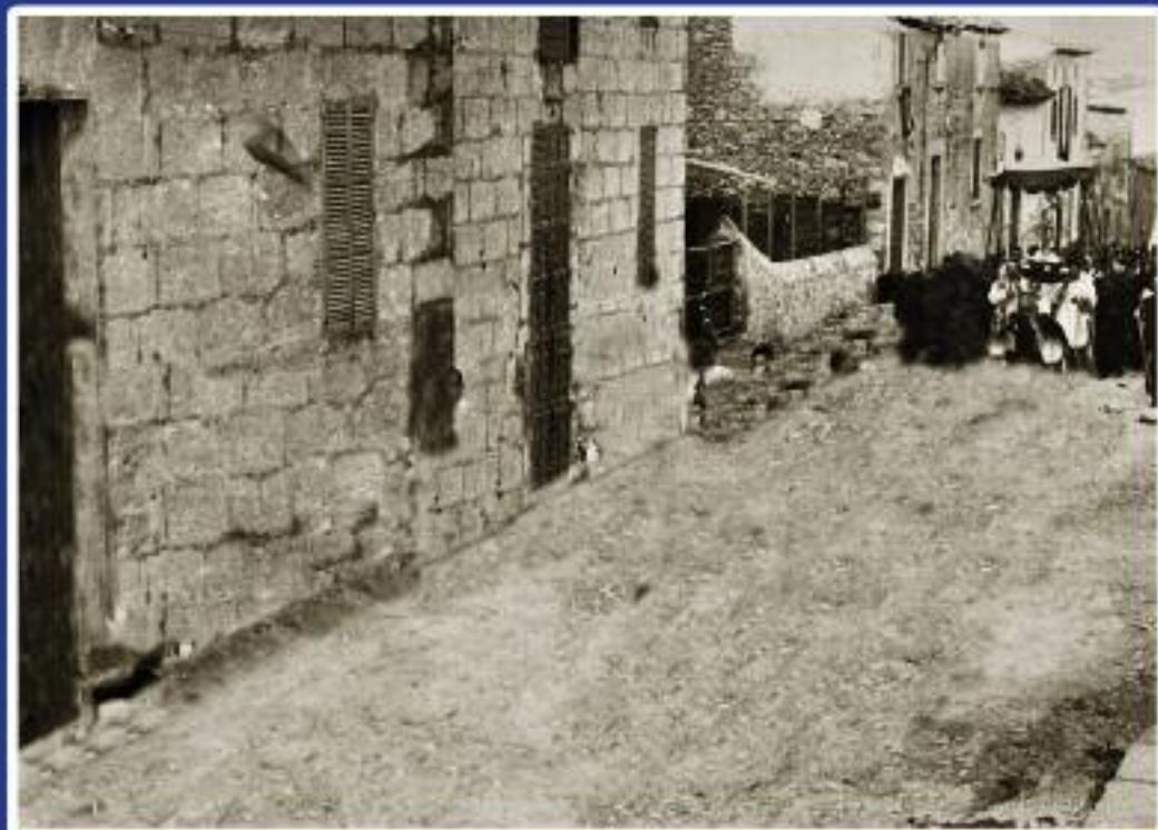
Moscarí . Carrer de Campanet, imatge d'ahir - imatge d'avui