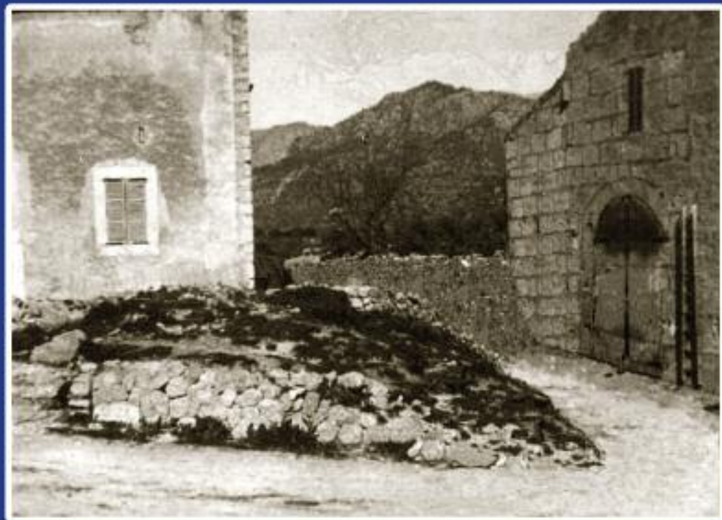
Moscarì . Ca'n Calco, imatge d'ahir - imatge d'avui