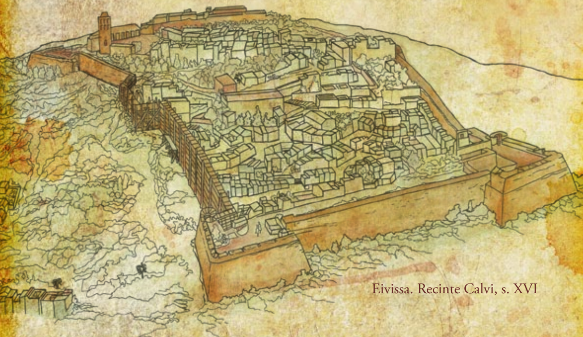
Eivissa. Recinte Calvi, s. XVI