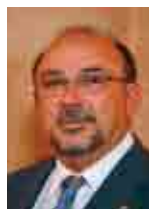
Bartomeu Llinàs Ferrà Conseller d'Educació i Cultura del Govern de les Illes Balears

I, com que no seria gaire institucional acomiadar-me desitjant allò que sempre es desitgen els comedians entre ells (ja sabeu quina és la fórmula), sols diré això: molta sort, i que s'obri el teló!