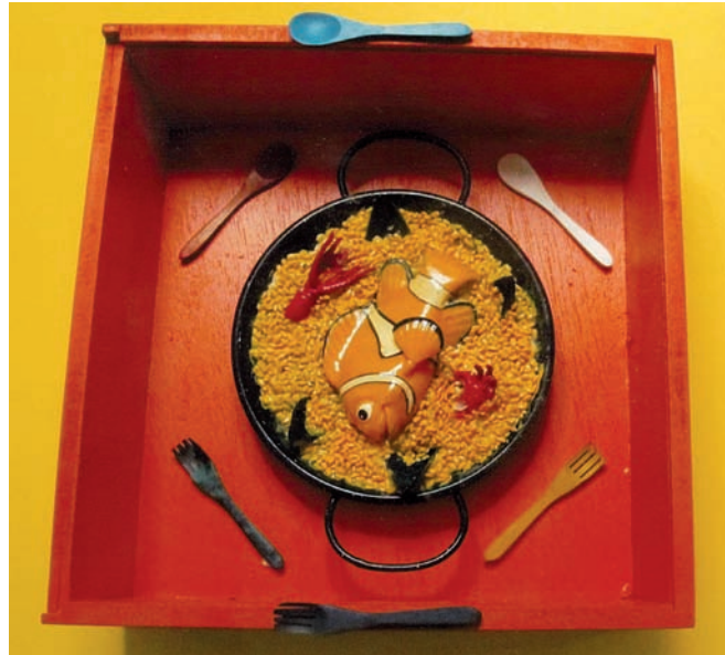
Exposició dedicada a Toni de la Mata