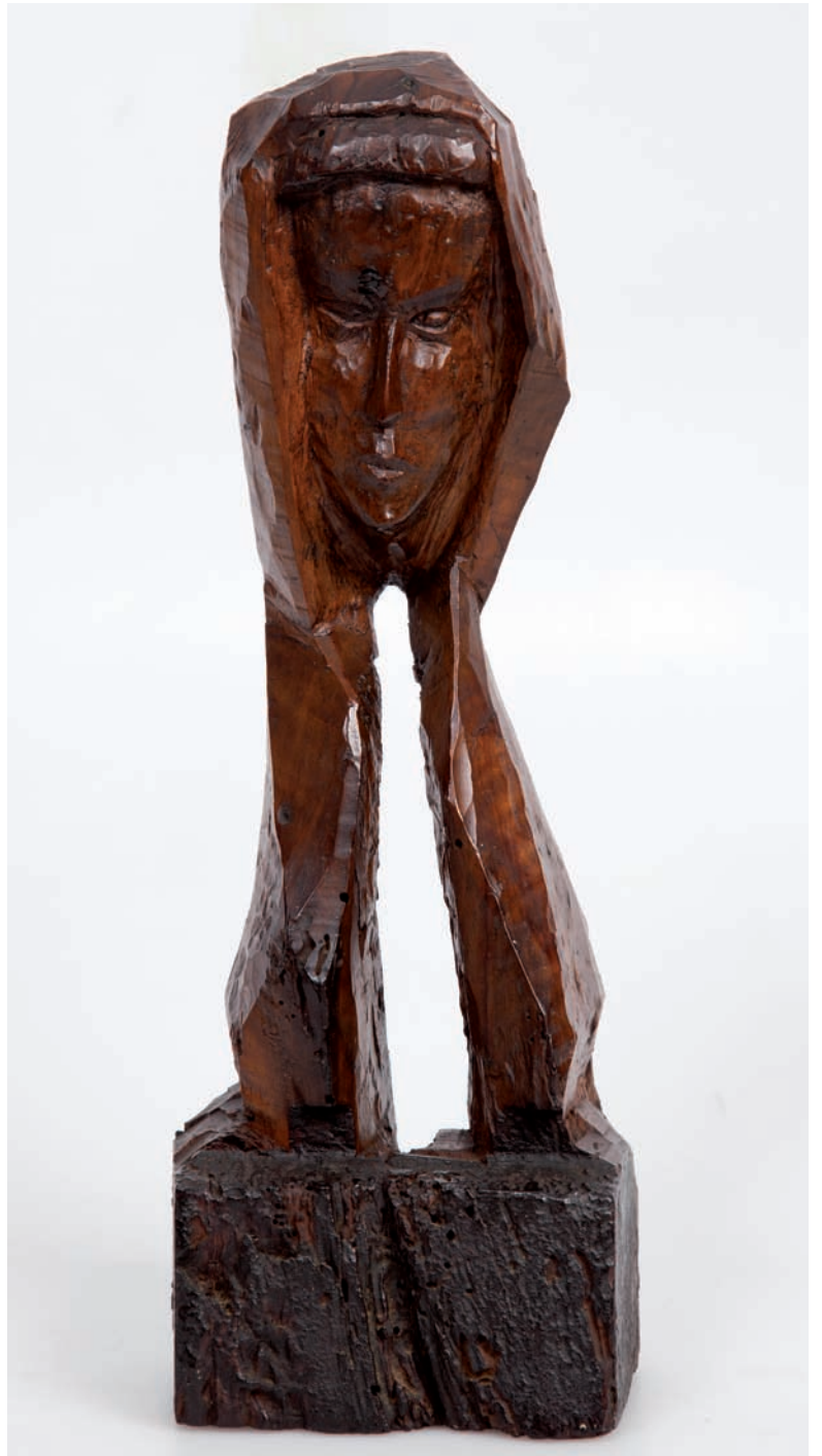
De la meva primera exposició. Any 1964.