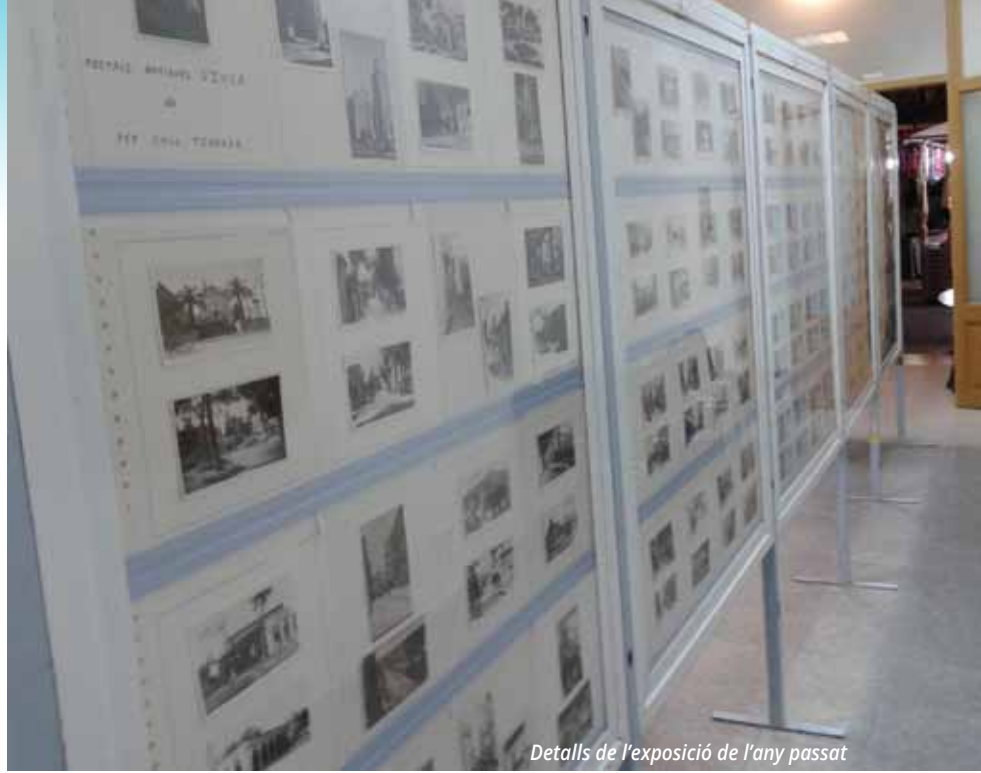
Detalls de l'exposició de l'any passat