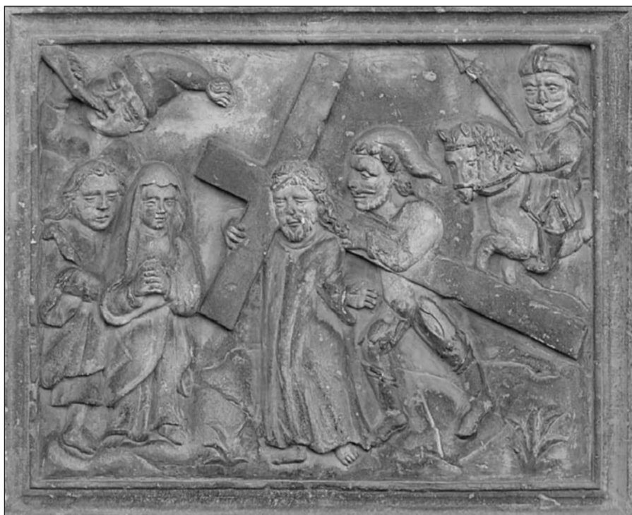
ESTACIÓ IV: Crist es troba amb la seva mare.

de Rams, també anomenada "processó dels Dotze Sermons". De ben segur que el nom li venia per les dotze estacions que conformen el viacrucis, ja que la processó seguia el recorregut de les estacions, i s'anava aturant davant cada una d'elles per realitzar una oració o sermó. El recorregut, que començava i acabava a la Parròquia de Sant Miquel, passava pels diferents carrers i places que l'envolten: plaça de sa Font, carrer Major, carrer del Mar, plaça de s'Arraval, carrer de la Costa, plaça Constitució, carrer Pare Catany (en el seu moment anomenat Costa d'en Marc) i el carrer de Nuno Sanç. Vos animam a fer una volta pels carrers del centre de Felanitx seguint aquest recorregut, i a intentar descobrir els dotze misteris del viacrucis.